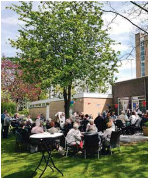
Het terras van het Terwaerderveldje

Het terras bij het Terwaerderveldje in Ubach over Worms is groter gemaakt, er is een extra bank geplaatst en het is opgefleurd met bloemen. De bewoners openen het nieuwe terras feestelijk en nodigden daar ook de buurtbewoners bij uit. Het werd een gezellige middag. Het nieuwe terras is mogelijk gemaakt door de inzet van vrijwilligers, het Leefbaarheidsfonds van HEEMwonen en Samen voor Elkaar (initiatief van o.a. gemeente Landgraaf en Welsun).