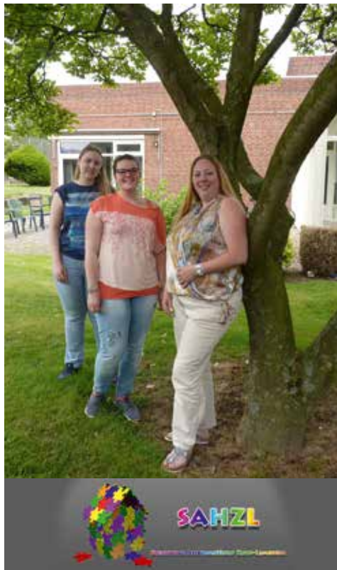
Een deel van het team van SAHZL

We zijn heel blij met dit pand. Het is ruim en er is een eigen sport- en muziekruimte. Er komt nu een nieuwe keuken en de tuin is fantastisch. Je woont hier niet in een instelling, maar komt echt