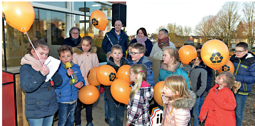
Feestelijke opening expogebouw op 22 februari 2018

In het SUPERLOCAL-project in Bleijerheide gebeurt veel. HEEMwonen, gemeente Kerkrade en IBA Parkstad werken samen om de hoogbouwflats en de openbare ruimte in het projectgebied in Bleijerheide ingrijpend te veranderen tot een fijne woonomgeving met ongeveer 125 sociale huurwoningen en 25 vrije sector woningen.