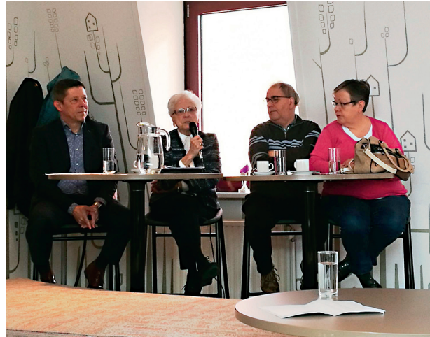
Huurders in gesprek met HEEMwonen

Meedenken kan ook via ons HEEMpanel. Eind 2016 startte HEEMwonen met het HEEMpanel, een online panel waarbij