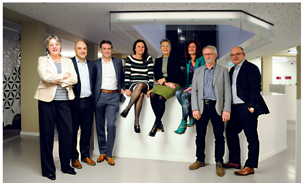
De Raad van Commissarissen van HEEMwonen

RvC staat voor Raad van Commissarissen. Deze raad bestaat uit zes, onafhankelijke leden die toezicht houden op de strategie, financiën en organisatie van HEEMwonen. Samen met het bestuur van HEEMwonen zorgen ze ervoor dat HEEMwonen op koers blijft en toekomstbestendig is. Ook is de RvC werkgever van de directeur-bestuurder. Zo'n zes keer per jaar overlegt de RvC met de directeur-bestuurder van HEEMwonen over diverse zaken, zoals lopende projecten, organisatieveranderingen, strategie, jaarverslag, afdelingsplannen, kwaliteit dienstverlening, prestatieafspraken, samenwerking met aannemers en grote