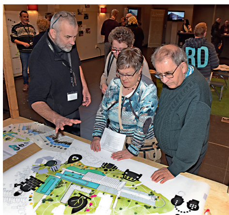
Tijdens het buurt-evenement op 24 februari 2018 dachten omwonenden actief mee over de plannen van het SUPERLOCAL-project.

Wist u dat hergebruik van materialen in de toekomst steeds belangrijker wordt bij het bouwen van woningen? Bij de productie van beton komt namelijk een enorme hoeveelheid CO2 vrij, dit is slecht voor het milieu. Door in dit project geen nieuwe flat te bouwen maar de oude te renoveren, verbruiken we 805.000 kilo minder CO2.