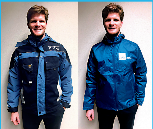
De bedrijfskleding van HEEMwonen en van PVM