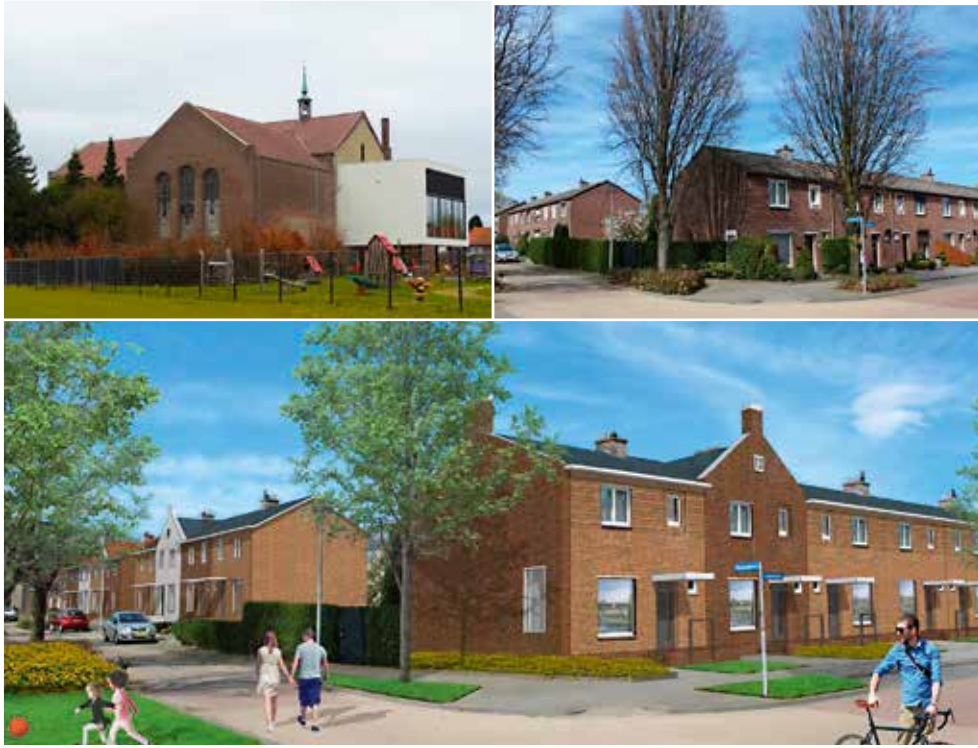
De ontwikkeling in de Heilust