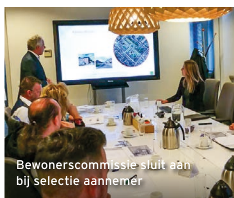
Bewonerscommissie sluit aan bij selectie aannemer

andere bewoners deze spullen gratis konden overnemen. Deze opruimdag was een groot succes. Er is veel opgeruimd en veel speelgoed geruild. Er waren gezellige gesprekken onder het genot van een kop koffie en een plak cake.