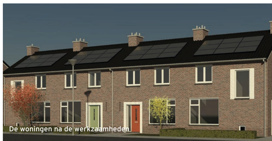
De woningen na de werkzaamheden

Met de onderhoudswerkzaamheden voor de deur hebben bewoners vaak