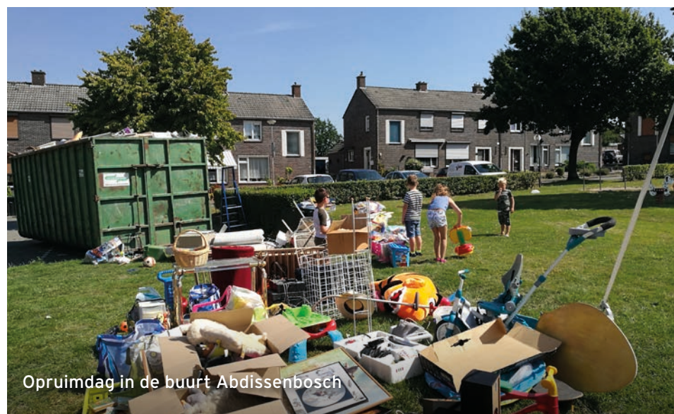
Opruimdag in de buurt Abdissenbosch

de behoefte om hun huis op te ruimen. Daarom nodigden HEEMwonen en BAM Wonen de bewoners uit voor een opruimdag. Spullen die niet meer bruikbaar waren, konden zij in de containers gooien. Spullen die nog goed waren, konden zij afgeven zodat