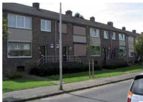
Situatie vóór renovatie

De woningen aan de Servatiusstraat, Canisiusstraat en Pancratiusstraat in Kerkrade-Oost zijn voorzien van kunststof kozijnen met energiezuinige beglazing en de woningen kregen geïsoleerde daken en buitengevels. Ook konden bewoners in een aantal gevallen kiezen voor een nieuwe wc, badkamer en keuken.