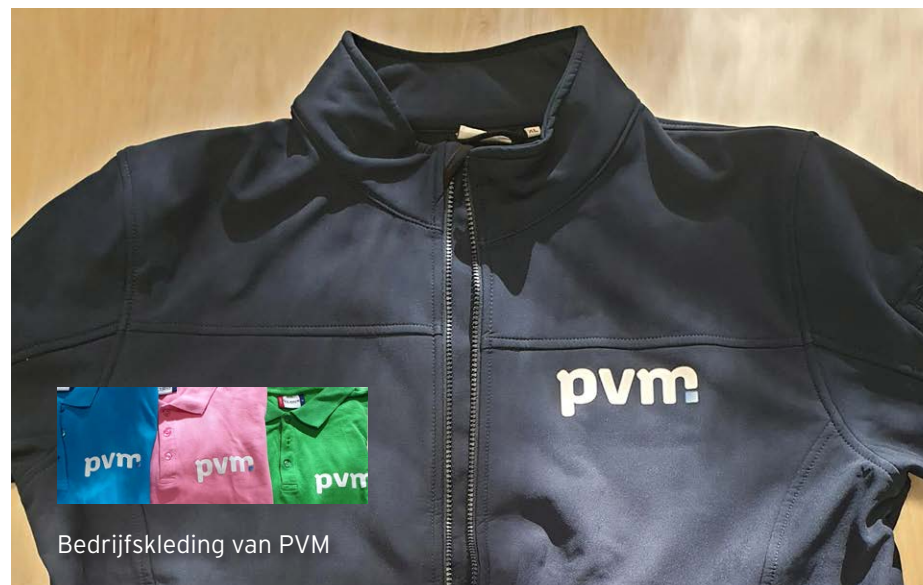
Bedrijfskleding van PVM

Om straks te kunnen reageren op een woning uit het project moet u ingeschreven staan bij Thuis in Limburg.