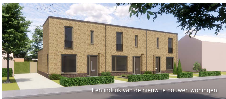
Een indruk van de nieuw te bouwen woningen

In de Landgraafse wijk Oud Nieuwenhagen bouwt HEEMwonen 21 betaalbare, levensloopbestendige woningen. De bouw vindt plaats op 4 locaties. Aan de Clausstraat worden 6 woningen gebouwd, de Johan Frisostraat en de Heiveldstraat krijgen er ook 6. Aan de Wilhelminastraat worden 3 woningen gebouwd. BAM Wonen voert het project uit.