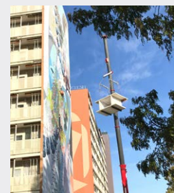
Drie delen van een appartement worden uitgehesen. Een spectaculaire operatie.

Uithijsmoment: drie delen van een appartement zijn met een 52-meter hoge hijskraan uit een hoogbouwflat gehesen. Daarvan wordt een Exposegebouw gemaakt. De rest van de flat wordt gesloopt.