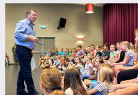
Leerlingen van de basisschool denken mee over SUPERLOCAL.

Toekomstmarkt Bleijerheide. Bewoners van Bleijerheide denken mee over de toekomst van hun buurt.