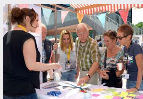
Toekomstmarkt voor bewoners van Bleijerheide.

Samenwerkingsovereenkomst HEEMwonen en gemeente Kerkrade