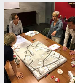
De klankbordgroep denkt vanaf het begin mee over het projectgebied.

Klankbordgroep SUPERLOCAL gaat van start en wordt betrokken bij de ontwikkeling van het stedenbouwkundig plan.