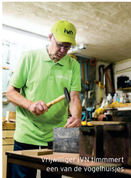
Vrijwilliger IVN timmert een van de vogelhuisjes

Aan de Prins Bernhardstraat en Mgr. Hanssenstraat in Landgraaf vervangt HEEMwonen de oude duplexwoningen voor nieuwbouw. De sloop is gestart. Hoe die nieuwe woningen eruit gaan zien, dat weten we nog niet precies. We onderzoeken daarvoor eerst wat de woonbehoeften zijn in de wijk. En welke doelgroepen er zijn. In de huidige woningen, woonden echter niet alleen onze huurders. Ook huismussen, dwergvleermuizen en gierzwaluwen maakten er hun thuis. Ze bouwden bijvoorbeeld nesten onder dakpannen, in spouwen en in nissen. Ook hun woning ging dus verdwijnen. HEEMwonen vindt het belangrijk om de natuur te beschermen wanneer we woningen renoveren, slopen en bouwen. We begeleiden hier niet alleen onze huurders naar een andere woning. We zorgden er ook voor dat de dieren een nieuw (tijdelijk) thuis kregen.